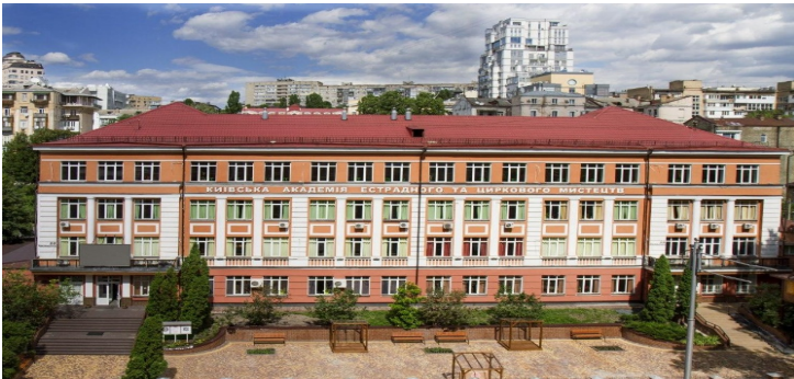
Київська муніципальна академія естрадного та циркового мистецтв

Київська муніципальна академія естрадного та циркового мистецтв, як провідний навчальний заклад у галузі сучасної музичної, сценічної та циркової освіти, відіграє ключову роль у підготовці висококваліфікованих артистів, зокрема вокалістів.