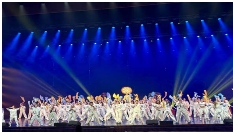
«Зірковий Маніфест». Фінальна сцена

Проєкт «Зірковий Маніфест» є яскравим підтвердженням високого рівня підготовки студентів Київської муніципальної академії естрадного та циркового мистецтва, зокрема в аспекті всіх жанрів мистецтва. Участь студентів у такому масштабному шоу не лише надає їм безцінний сценічний досвід, а й є свідченням ефективності освітніх програм, спрямованих на практичну орієнтацію та професійне становлення майбутніх артистів.