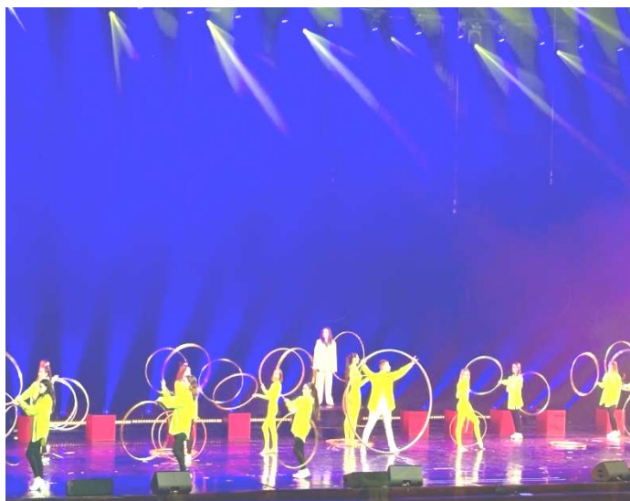
«Зірковий Маніфест» 2025 р.

У контексті естрадно-циркового шоу «Зірковий Маніфест» означає, що вокал, танець та цирковий трюк не існують окремо, а є взаємозалежними компонентами єдиної концепції. Усі елементи шоу – музика, вокал, рух, трюк, світло, костюми – підпорядковуються єдиній художній ідеї та емоційному посилю. Це дозволяє створити цілісне враження всього шоу.