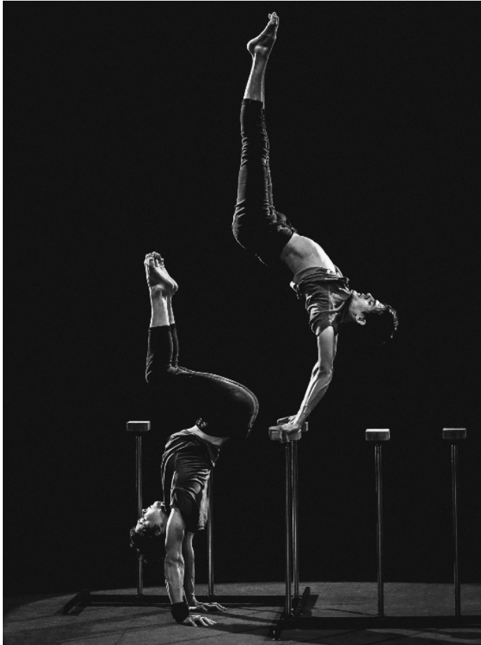
Рисунок 6. Фігурна стійка на двох руках