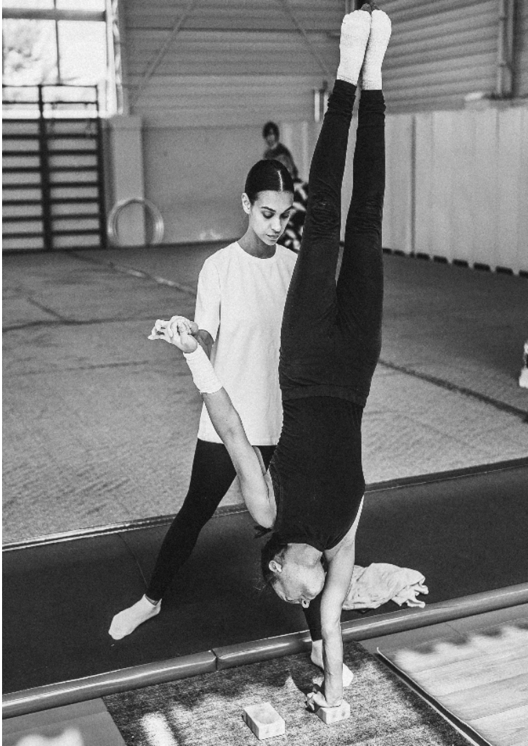
Рисунок 1. Стійка на одній руці