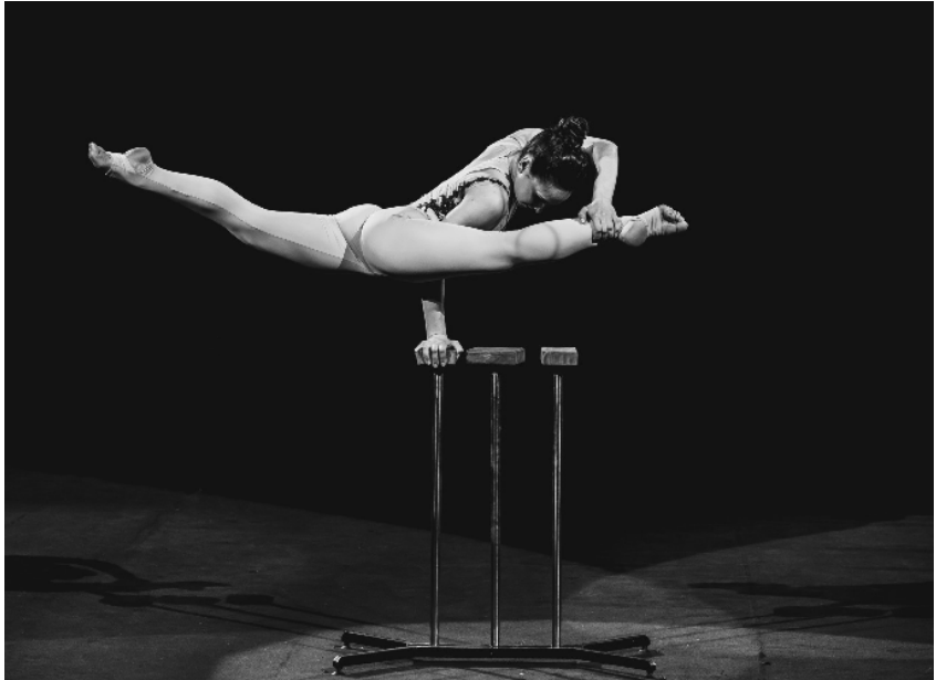
Рисунок 8. Рівновага на лікті в «шпагаті»