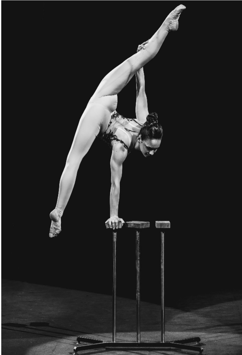
Рисунок 9. Стійка на правій руці в «шпагаті»