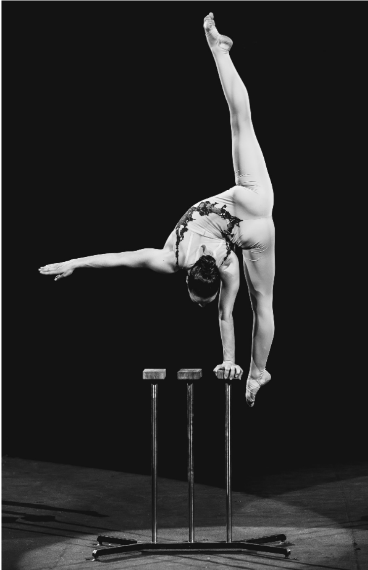
Рисунок 10. Стійка на лівій руці в «шпагаті»