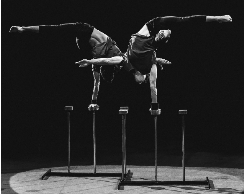
Рисунок 5. Стійка на одній руці «Японський флажок»