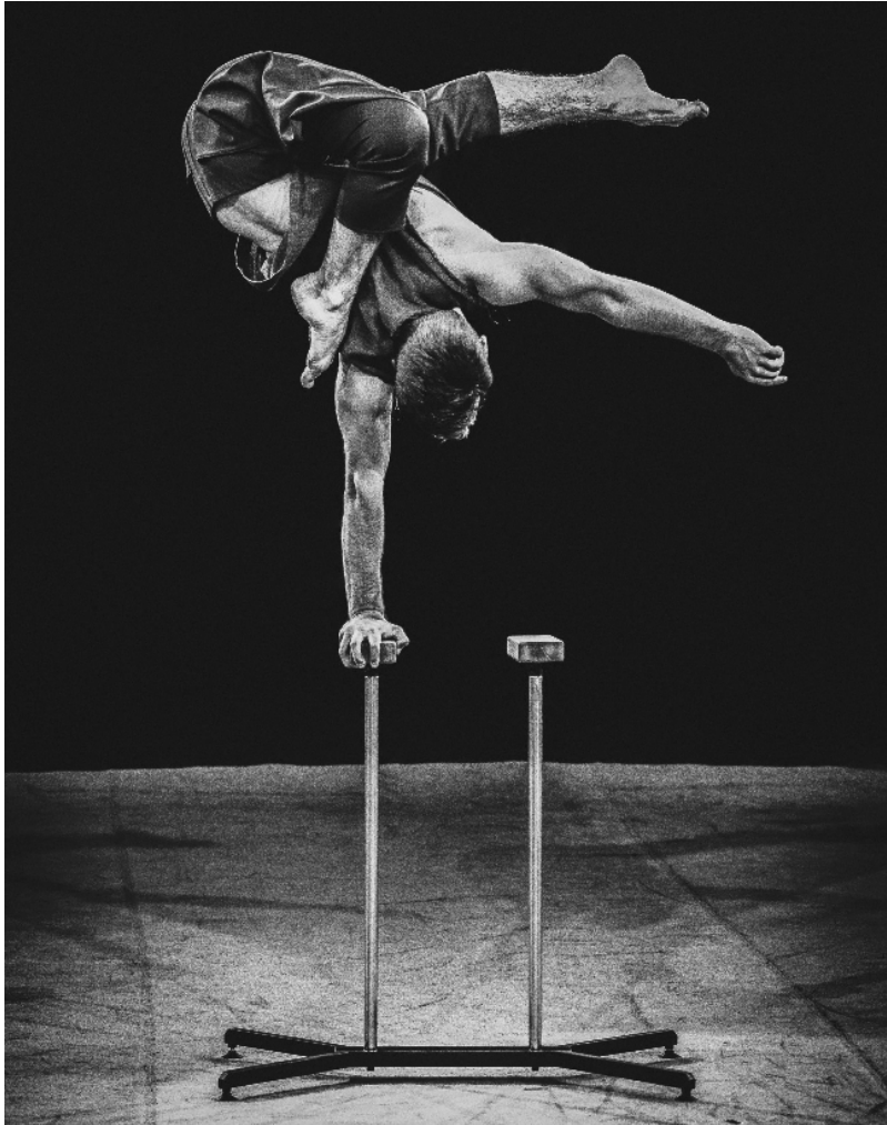
Рисунок 3. Сійка на одній руці «Фіґа» із закладкою