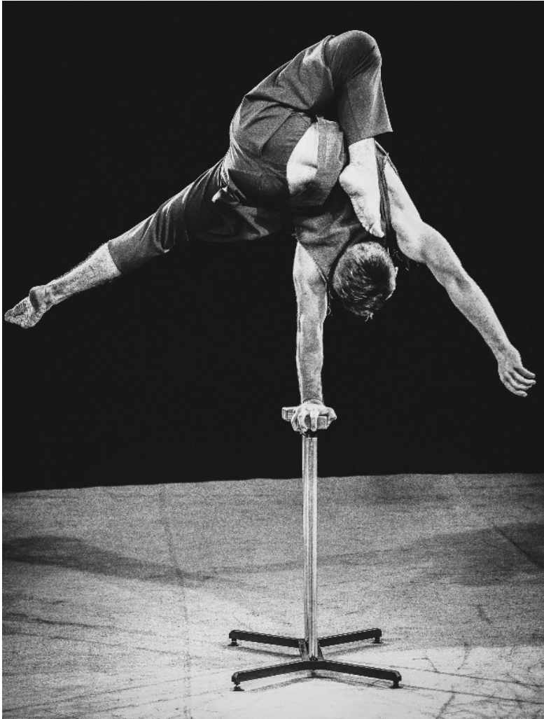
Рисунок 4. Стійка на одній руці «Флажок із закладкою»