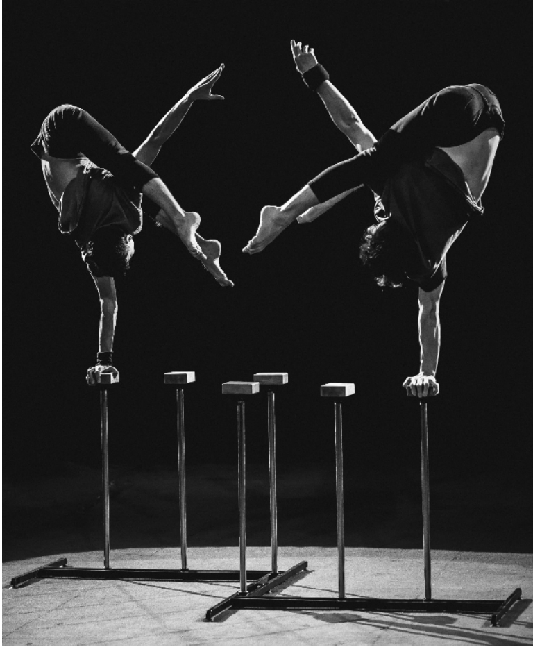
Рисунок 11. Стійка на одній руці «Фіга» з нахилом