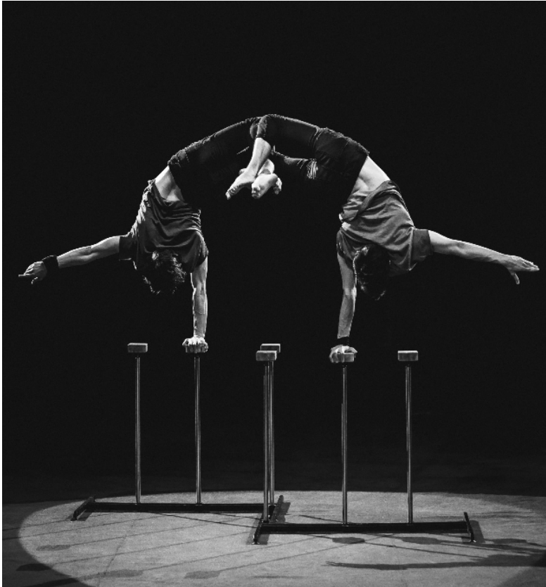
Рисунок 7. Бокова стійка на одній руці «Японський флажок»