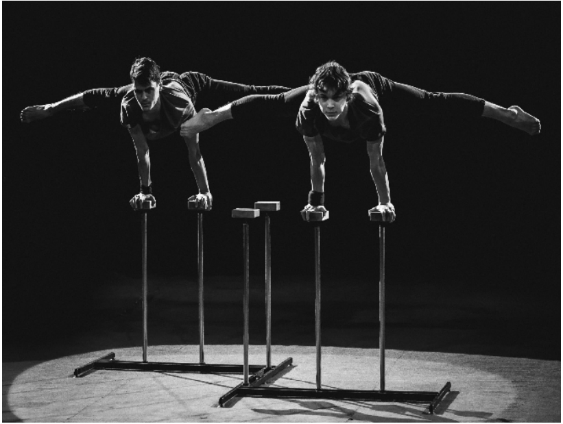
Рисунок 12. Стійка на двох руках «Горизонт»