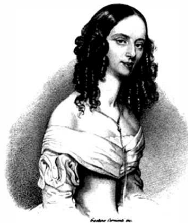
Teresa De Juli Borci

Обурення вилилося в протест 13 жовтня 1864 року під час вистави «Німої з Портічі» Д. Обера. Хоча артисти грали задовільно, після першого акту антрепренера викликали на сцену. В той момент частина зали не зрозуміла причину демаршу і заходила йому аплодувати. Наприкінці другого акту голосні вигуки зупинили хід опери — знову викликали антрепренера. Цього разу його засвітали глядачі партеру і третього ярусу. За повідомленням присутнього на цій виставі кореспондента «Journal d'Odessa», скарги, які висловлювали глядачі в кулуарах, переважно стосувалися хибних рішень антрепренера в формуванні трупи, невиконання ним вимог контракту щодо кількості оперних прем'єр 4 . Щоб знизити градус напруги в театрі, задобрити публіку та врятувати свою репутацію, В.Серматтеї був змушений ангажувати до складу трупи європейську знаменитість — Терезу Де Джулі Борсі (ілюстрація 4).