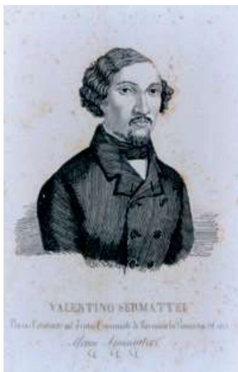
Ілюстрація 1. Портрет В. Серматтеї

Контракт, укладений В. Серматтеї з міською думою, передбачав утримування міського театру впродовж шести років, з 1 березня 1859 року до початку Великого посту в 1865 році. Упродовж цього періоду антрепренер зобов'язувався на монопольних правах організувати регулярні виступи італійської оперної та російської драматичної труп, мати добрий театральний оркестр, за власний кошт забезпечувати вистави декораціями і «всім необхідним для постановки нових спектаклів» 1 .