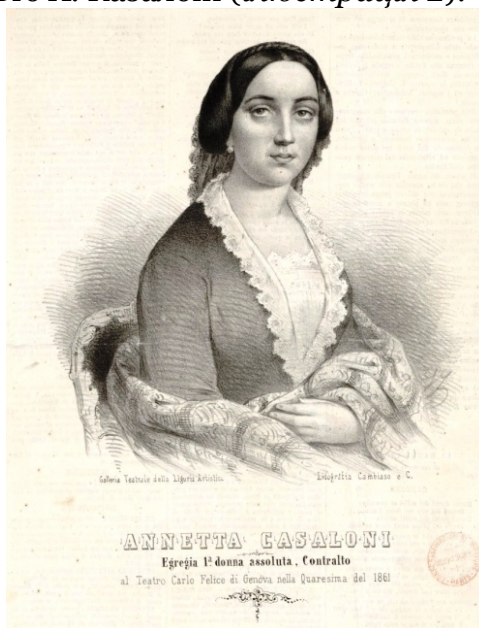
Ілюстрація 2. Портрет примадонни-контральто Аннетти Казалоні

Чи не єдиним цінним надбанням у трупі наступного театрального року виявилась примадонна контральто А. Казалоні (ілюстрація 2).