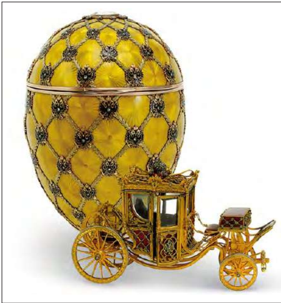
Ил. 7. Пасхальное яйцо «Коронационное». М. Перхин, Г. Штейн. Фирма К. Фаберже, 1896 г. Золото, платина, серебро, алмазы, хрусталь, бархат, эмаль