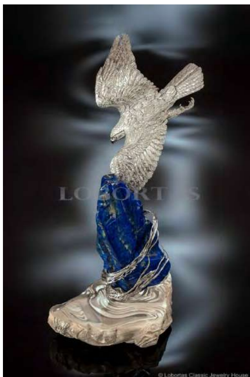
Ил. 2. «Сокол». Классический ювелирный дом «Лобортас». Серебро, золото, бриллианты, топазы, лазурит, пейзажный кремний