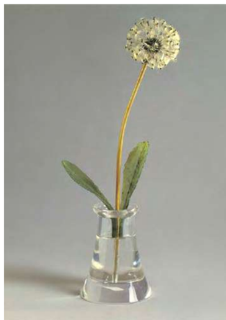
Ил. 6. «Одуванчик». К.-Г. Фаберже. 1914–1917 гг. Золото, нефрит, бриллианты, горный хрусталь, пух одуванчика

Обращались мастера при изготовлении таких композиций и к древесным мотивам – могли воспеть в металле и камне, например, ветки березы с сережками, бонсай («Бонсай», Г. Вигстрем, ок. 1907-1908 гг., золото, эмаль гильоше, нефрит, агат, яшма, кварц), к ягодам (не раз обгрывались малина, морошка, земляника). Среди ювелирных ягодных композиций, например, «Ветка черники» (фирма К. Фаберже, 1880-е гг., золото, нефрит, лазурит, горный хрусталь), «Ветка красной смородины» (фирма К. Фаберже, н. XX в., золото, нефрит, эмаль, горный хрусталь), др. Многие из этих подарочных ювелирных композиций украшали столы русских императриц и княжен, часть впоследствии перекочевала в музеи Западной Европы (Дрезден, Баден-Баден), часть – в коллекцию английской королевы, некоторые постепенно возвращаются обратно в Петербург.