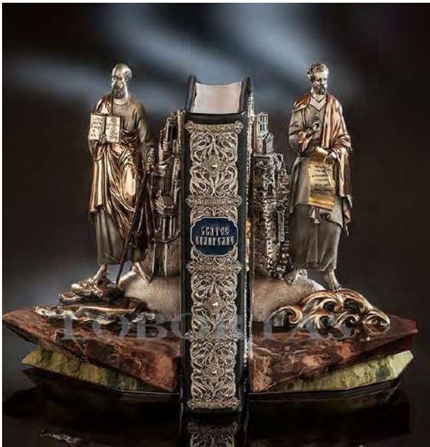
Ил. 10. Подставка для книг «Петр и Павел». Классический ювелирный дом «Лобортас». Серебро, золото, черные бриллианты, унакит, яшма