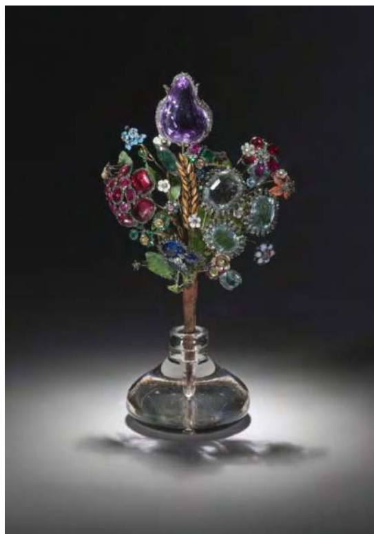
Ил. 3. «Букет цветов». И. Позье. 1740-е гг. Золото, серебро, бриллианты, топазы, аквамарины, рубины, сапфиры, изумруды, агаты, тигровый глаз, кахолонг, яшма, стекло, ткань