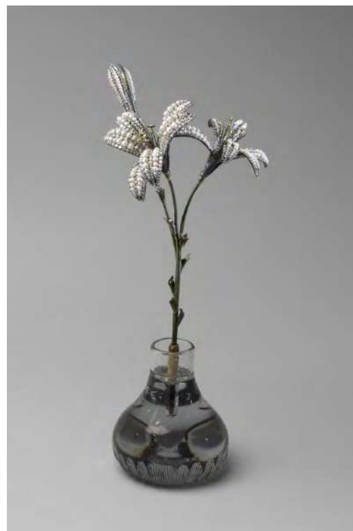
Ил. 4. «Ветка лилий в вазе». Мастерская Дювалей, 1790-е гг. Серебро, золото, жемчуг, бриллианты, алмазы, хризолиты, стекло, медь