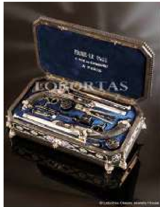
Ил. 9. Пара дуэльных пистолетов Faugre-Le Page. Оружейная миниатюра.

Вторая категория интерьерных ювелирных композиций – изделия, выполняющие как эстетические, так и утилитарные функции, в современных условиях чаще всего используемые для оформления деловых интерьеров и имеющие статус кабинетных украшений. Однако их история довольно богата, апогей популярности приходится примерно на к. XIX – нач. XX вв., что во многом тоже обусловлено расцветом деятельности фирмы К. Фаберже. Ассортимент весьма богат, но часть из изделий той эпохи уже вышла из употребления, поэтому в современном мире заменена на другие, отвечающие запросам времени. Большой популярностью пользовались вполне функциональные письменные