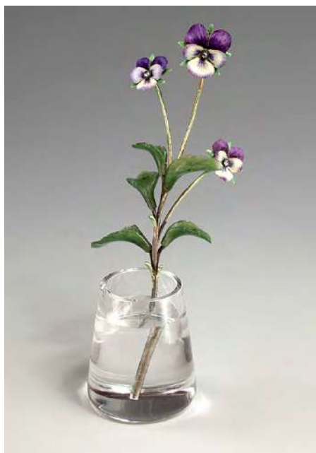
Ил. 5. «Анютины глазки». Г. Вигстрем. Золото, алмазы, нефрит, горный хрусталь, эмаль