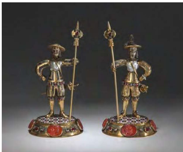
Ил. 1. «Алебардисты» . Неизвестный мастер, нач. XVIII в., Германия. Позолоченное серебро, алмазы, алмандины, барочный жемчуг, сердоликовые камей, эмали