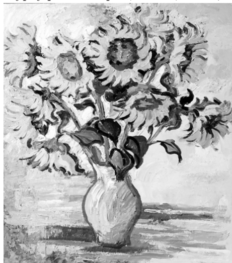
Рис. 6. О. Карпенко. «Подсолнухи». 2015 г., холст, масло

с запахом Сера («Бухта в Симеизе», 2002 г., масло, рис. 4; «Гурзуф. Айдалары», 2005 г., масло).