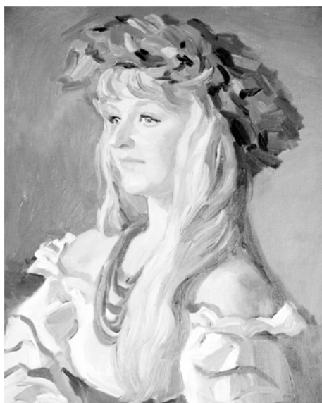
Рис. 10. «Роменская красавица». 2010 г., холст, масло

Все модели художника очень выразительны, «пойман» характер образа, особенно яркими выглядят образы пожилых людей – в них цепкий глаз автора легче передает все специфические черты индивидуальности модели.