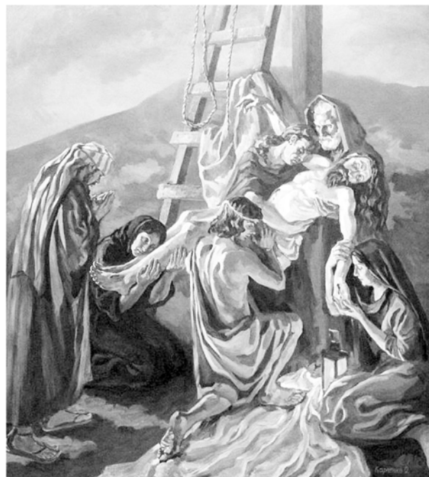
Рис. 11. О. Карпенко. «Снятие с креста». 2005 г., холст, масло

го незнания пластической анатомии и неумении рисовать человеческую фигуру. Мифологические и религиозные работы конца 1990-х – начала 2000-х гг. довольно глобальны по замыслу, сложны по композиции и весьма разнообразны по палитре – здесь Ольга перестает быть узнаваема по колориту и манере живописи и каждый раз избирает новый подход. В нескольких работах она отдает предпочтение латуровской контрастности, обращаясь к тенеброзо и ее холст буквально светится. Принцип латуровской свечи можно увидеть в «Легенде об огне» (2002 г., масло), еще более явно он использован в масштабном (более 2 м по большей стороне) «Снятии с креста», где вся композиция строится на отблесках огня светильника, стоящего у распятия (2005 г., масло, рис. 11). Есть и композиции, в которых Ольга снова становится свободно-импрессионистически настроенной, используя широкий мазок и не привязываясь к доминирующей роли линии, нивелируя роль контура, что в ее живописи встречается не так часто («Снятие с креста», 2003 г., масло).