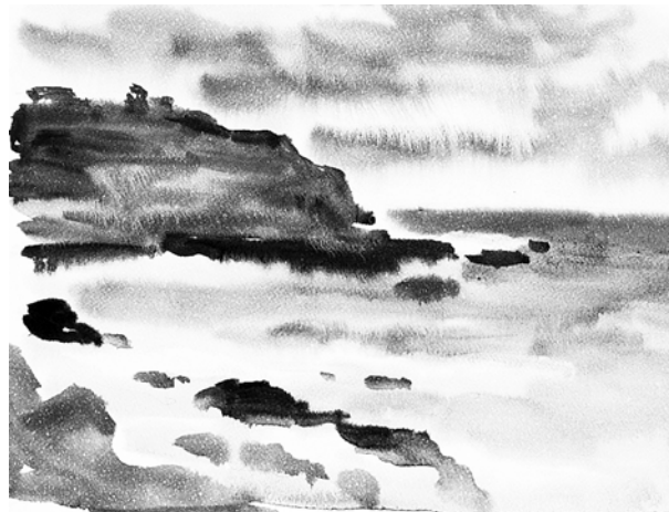
Рис. 12. О. Карпенко. «Шторм». 2011 г., бумага, акварель