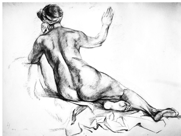
Рис. 2. О. Карпенко. «Обнаженная со спины», 1998 г., картон, уголь