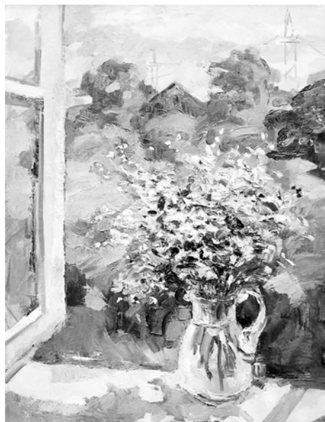
Рис. 7. О. Карпенко. «Полевые цветы». 1999 г., холст, масло