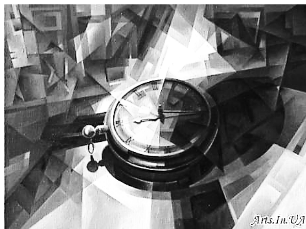
Рис. 6. В. Кротков. «Золото на голубом». 2016 г., холст, масло