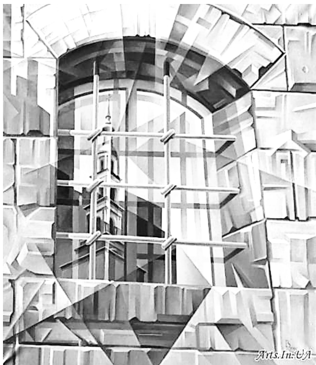
Рис. 1. В. Кротков. «Звонница». 2015 г., холст, масло

мощь громады собора и выгодно демонстрирующий умение рисовальщика. Прозрачность питерского духа, которую ощущаешь всегда, «пролетая по белым ночам опьяненной души», соткана из клиновидных плоскостей, составляющих мозаику неба, на фоне которого высится купол «Монферранова чуда». Они интересно расположены, и небо, не только формы образов, распластано на клинья, геометризировано, разбито на осколки, что придает работе привычную для живописца декоративность. Светлые части этих осколков, разные по силе тона, причудливо складываются в подсознании зрителя так, что образуется некий крест, по форме подобный Андреевскому, повторяющийся несколько раз, своего рода «противотанковый еж» или перекрещивающиеся лучи прожекторов, режущие тьму неба... Вина ли это влюбленного в Петербург воображения, или заслуга мастерской кисти художника, но это порождает комок, подкатывающий к горлу: невольно вспоминается, что колонны этой твердыни были изранены осколками фашистских снарядов, и следы от этих ран, свидетели блокадного Ленинграда, до сих пор лежат на челе «Исаакия» немым укором... Автор этого полотна действительно с «городом дождей мазан одним мирром».