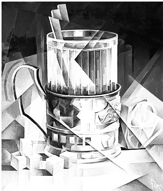
Рис. 3. В. Кротков. «Чай». 2015 г., холст, масло

(2016 г., холст, масло) с открытым чемоданом и портретом Хемингуэя на стене, «Конец истории» с открытым ящиком стола на первом плане (2016 г., холст, масло), «Дверные звонки» (2016 г., холст, масло), «Пустой дом» (2016 г., холст, масло) – апофеоз безнадежности, но с оставленным шансом в виде горящего окна, «The end» (2016 г., холст, масло), «Жизнь на воде» (2016 г., холст, масло – по признанию самого мастера – идеал образа жизни в отдалении от суеты [1]). Каждая работа – история, рассказываемая каждым зрителем по-новому. И вряд ли хоть кто-то попадет в ноты, предложенные самим художником.