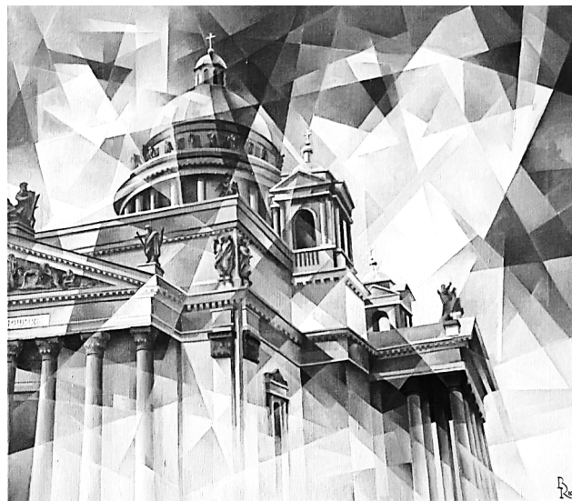
Рис. 2. В. Кротков. «Черный пес Петербург». 2016 г., холст, масло

Отдельной линией воспринимаются композиции, жанровую принадлежность которых классифицировать однозначно вряд ли можно: это композиции, часто интерьерные, с вкраплением натюрморта, часто с повествовательным налетом, короткие истории без главного героя – некие «эссе пустоты», каждый холст – глоток «философии пустоты». Так воспринимаются полотна «Пикник на обочине» с бутылкой и бокалом вина на стуле (2015 г., холст, масло), «Навсегда»