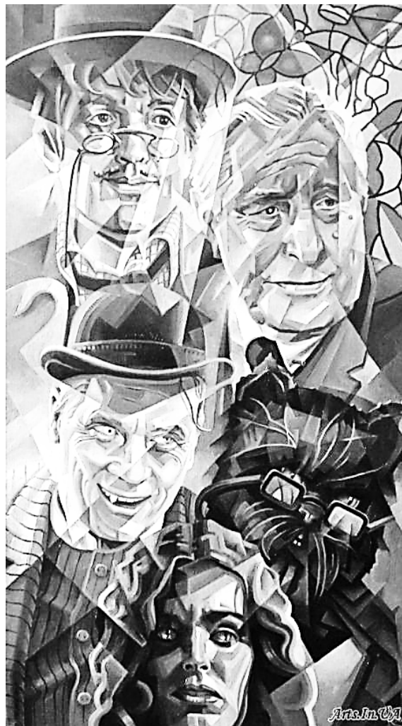
Рис. 5. В. Кротков. «Как причудливо тасуется колода!» 2016 г., холст, масло

ста, повидавшего виды и ищущего визуализацию всей своей житейской мудрости и персонификацию невзгод, «Харон» (2014 г., холст, масло), «Бумажный кораблик» (2016 г., холст, масло), гораздо более оптимистичный по звучанию.