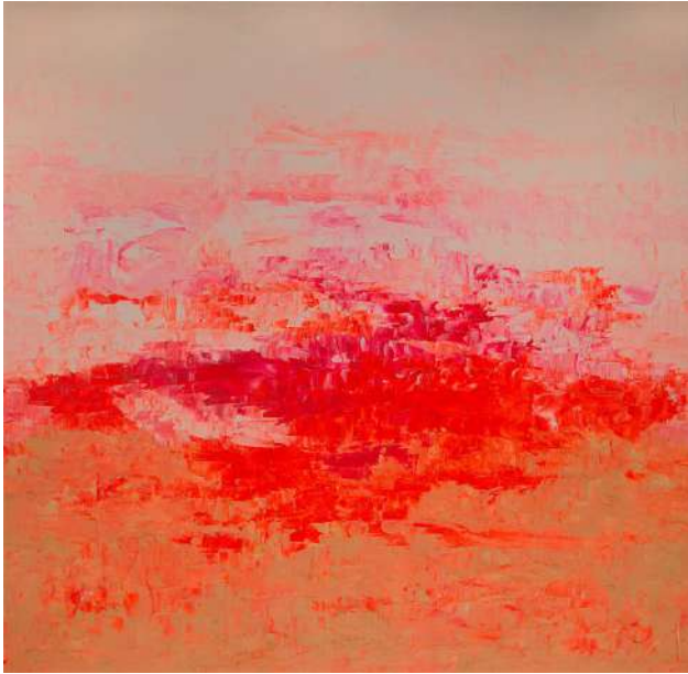
Рис. 3. Роготченко К. «Величие небес». Холст, масло

сыл на зрителя. Экспрессивности придает и фактура мазка ряда работ, в которых можно видеть ту мощь и энергию, которые достигаются только таким способом, мастихинными размашистыми мазками, смело и быстро («Величие небес», холст, масло, рис. 3).