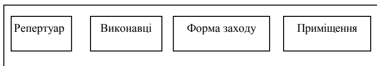
Рис. 2. Складові компоненти концерту як публічної форми репрезентації музики

На рис. 2 концерт показано як одиничний акт публічної репрезентації музики, де окреслено його компоненти, поза якими він не може існувати.