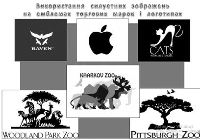
Фото 2. Використання силуетних зображень на емблемах торговельних марок і логотипах

Завершальним «майданчиком» подорожі шляхами силуетних зображень є «сторінка» практичної роботи. Після переліку необхідних для роботи художніх матеріалів пропонується перегляд короткого відео і пояснення послідовності виконання творчого завдання «Уяви та домалуй образ»: