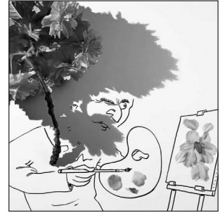
Фото 3–6. Вінсент Баль. Оригінальні художні образи

жується, і мотивувати учнів на виконання практичного завдання, яке потребує не лише значного зосередження, а й емоційного переживання, стає складно. Потрєте, вихід передач у прямому ефірі має бути регулярним, через визначений та заздалегідь обумовлений проміжок часу. Окремо слід зазначити залежність ефективності занять від якості Інтернету під час прямого ефіру. При цьому наголосимо: запис заняття дає можливість передивлятися його багато разів і звертатися до будь-якого фрагменту, зокрема й покрокового супроводу виконання художньо-творчого завдання.